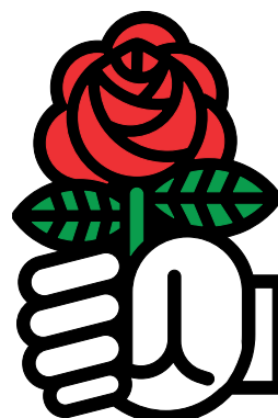
Juso-Hochschulgruppe über 75 KandidatInnen - immer die richtige Wahl